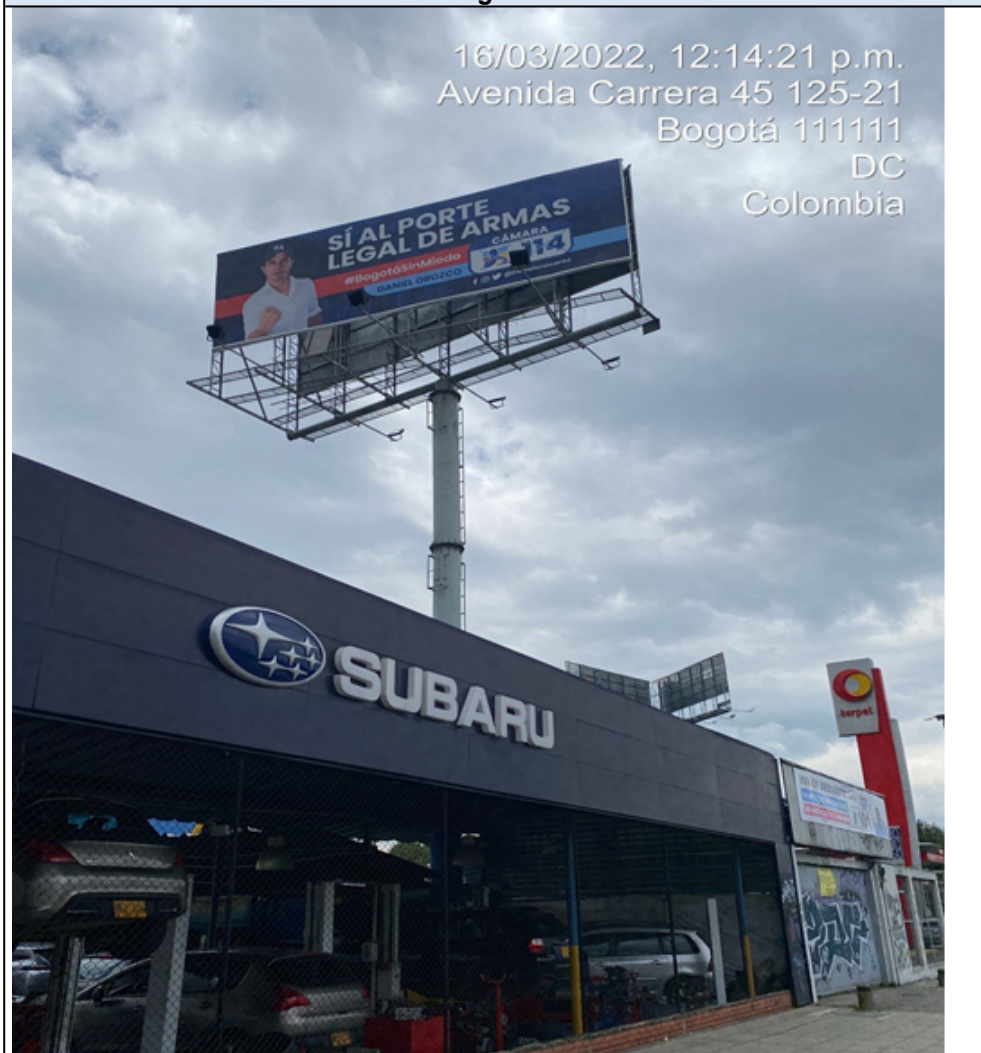
Foto Panorámica – Un (1) elemento tipo VALLA TUBULAR con publicidad política, con orientación visual SUR - NORTE sobre la KR 45, calzada oriental